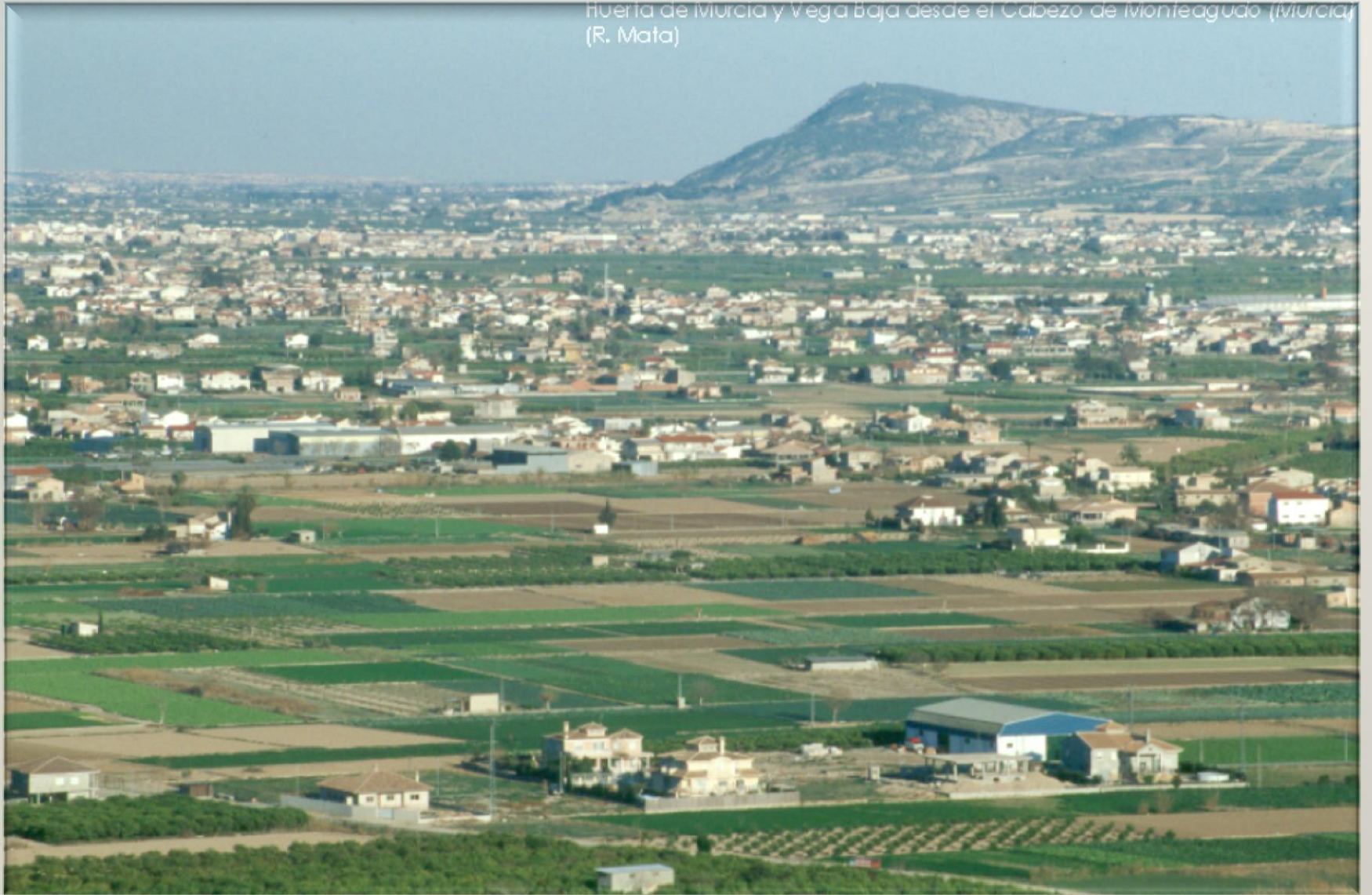
Huerta de Murcia y Vega Baja desde el Cabezo de Monteagudo (Murcia) (R. Mata)